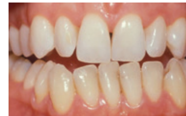
Resultaat na tien dagen bleken met de thuisbleekmethode onder supervisie van de tandarts