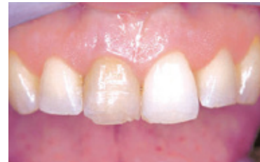
Dode tand vertoont donkere verkleuring.

vruchtensap, of andere kleurstof bevattende etenswaren. Bij het ouder worden kunnen er barstjes in het glazuur komen. Hierdoor dringen kleurstoffen uit voedsel en dranken nog makkelijker in de tand of kies. De ouderwetse almagaamvulling kan ook verkleuringen geven. Ook kunnen aanslag en verkleuring van tandsteen de tanden donkerder kleuren. Deze verkleuringen ontstaan eveneens door koffie, thee, wijn en roken. Verder kunnen gek genoeg sommige mondverzorgingsproducten met tin en chloorhexidine verkleuringen geven. Vraag dit aan uw mondzorgprofessional. Aanslag kan de tandarts of mondhygiënist door een professionele gebitsreiniging verwijderen. Bleken is hiervoor niet de oplossing. Dode tanden (meestal als gevolg van een val of klap) kunnen van binnenuit verkleuren. Dit kan ook gebeuren na een wortelkanaalbehandeling.