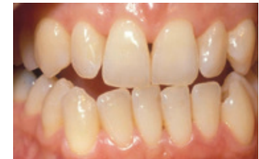
Voor het bleken

De lengte van een bleekbehandeling hangt af van de bleekmethode. Bij de thuisbleekmethode duurt het meestal twee tot drie weken voordat je het gewenste resultaat hebt bereikt.