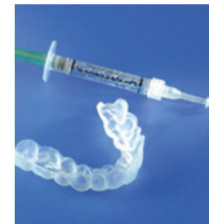
Van de tandarts of mondhygiënist krijg je de doorzichtige bleeklepel en de gel met de blekende werking mee naar huis

Eerst maakt de tandarts een opening aan de achterkant van de tand. Hierin brengt hij een papje of gel aan met het blekend middel. Deze producten hebben enkele dagen een blekende werking. Afhankelijk van het behaalde resultaat herhaalt de tandarts de behandeling één of meerdere keren. Uiteindelijk sluit hij de tand af met een definitieve vulling.